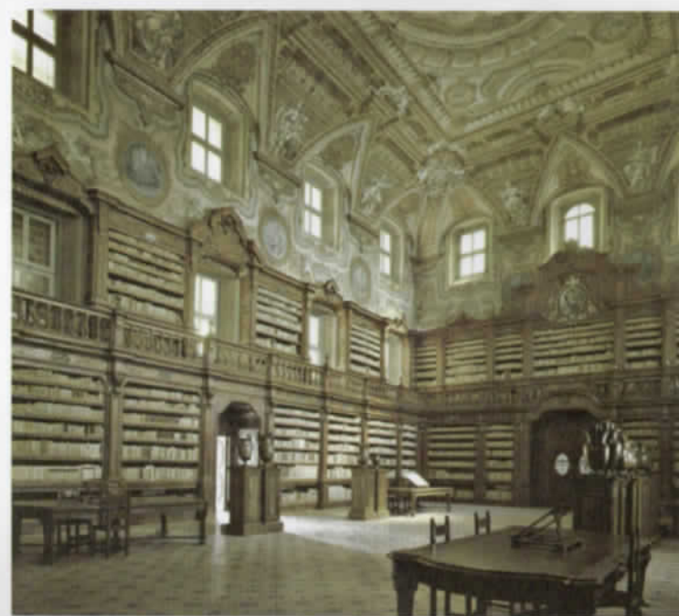
Girolamini 是教會和傳教士複合體的名字，也是義大利南部港市那不勒斯教會的綜合設施。

對忙於追求學術研究的人而言，進入公共圖書館是一種尋常經驗，甚至是每天例行的公事，也因此忽略了圖書館建築結構的美學品味，把它當成僅僅是堆滿書籍的閱讀空間。而馬西摩·李斯特利所帶給我們的，就是這些日常生活中被遺忘的美學價值。他深刻且細膩地，呈現出世界歷史遺跡的建築工藝與內部裝置藝術之美。