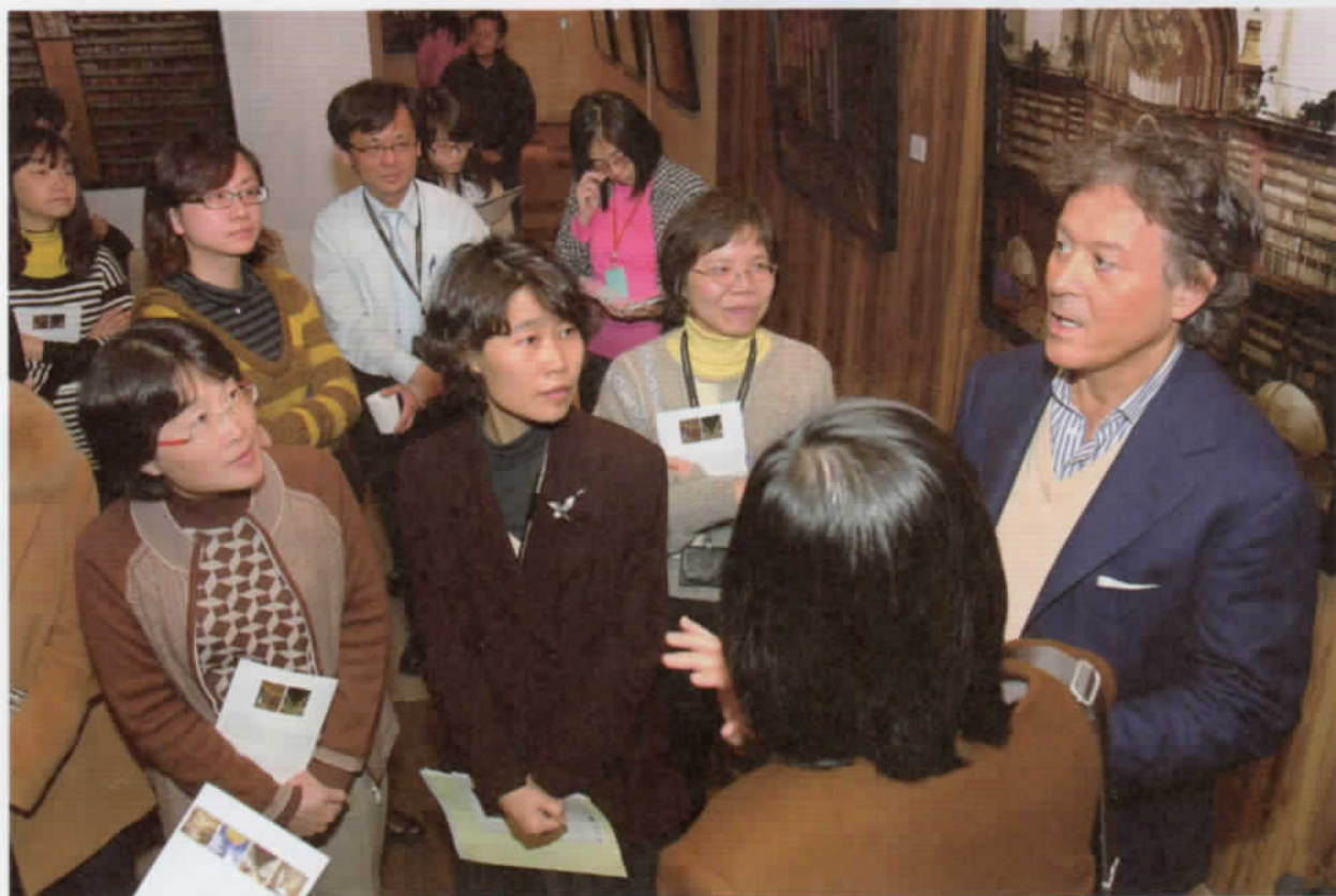
➤ 攝影家馬西摩·李斯特利於開展當天為民眾導覽解說。