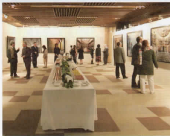
➤ 世界圖書館攝影展吸引大批國內外民眾前來欣賞馬西摩·李斯特利鏡頭下的圖書館世界。

生平已經出版59本書籍的馬西摩·李斯特利，這次也特地藉由來臺辦展的時間，為國家圖書館拍攝館內空間，並納入即將出版的第60本作品集裡，屆時也是書中唯一拍攝的一座華人圖書館。