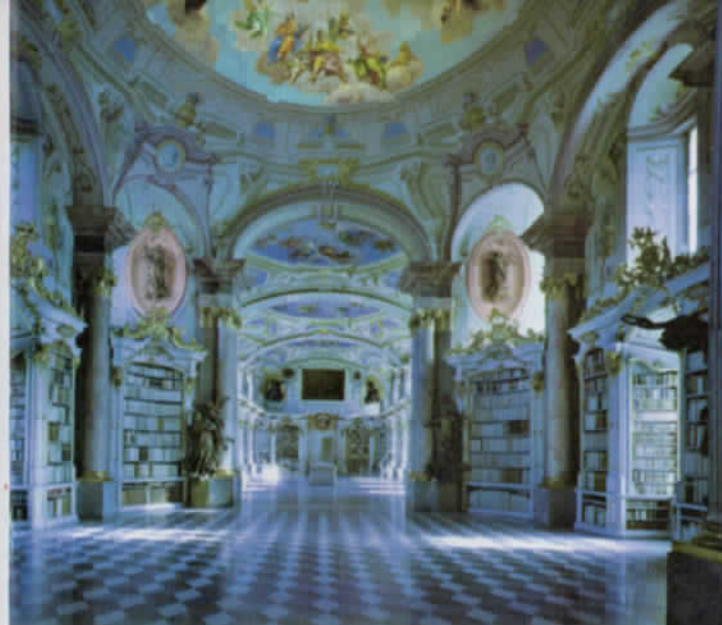
奧地利阿德蒙特 (Admont) 圖書館，被封為世界第八奇蹟，也是歐洲近代最大的巴洛克建築。

在此次展出的圖書館攝影作品中，馬西摩·李斯特利充分展現歐洲古文明的建築工藝與室內裝置藝術之美。在眾多作品裡，瑞士歷史最悠久的聖加侖 (Saint Gallen) 修道院圖書館，大廳以