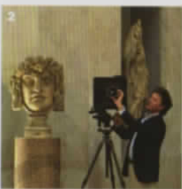
1. (Wiblingen Library in Germany) 德國維布林修道院，現為烏爾姆大學醫學院使用。 2. 攝影師Massimo Listri。 3. (Rivoli Castle in Torino) Rivoli城堡是Savoy皇室於Rivoli的故居，現為杜林當代藝術館。畫面中吊起的馬，為義大利當代藝術家Maurizio Cattelan作品 (Novecento)。 4. (Versailles II France) 法國凡爾賽宮一景，記錄下藝術展覽的幕後準備過程。 5. (Palazzo Altieri in Rome) 曾是Altieri家族居所，現為銀行。 6. (Castle of Pierrefonds France) Pierrefonds城堡座落於巴黎北方的Oise，為典型中世紀軍事城堡建築。