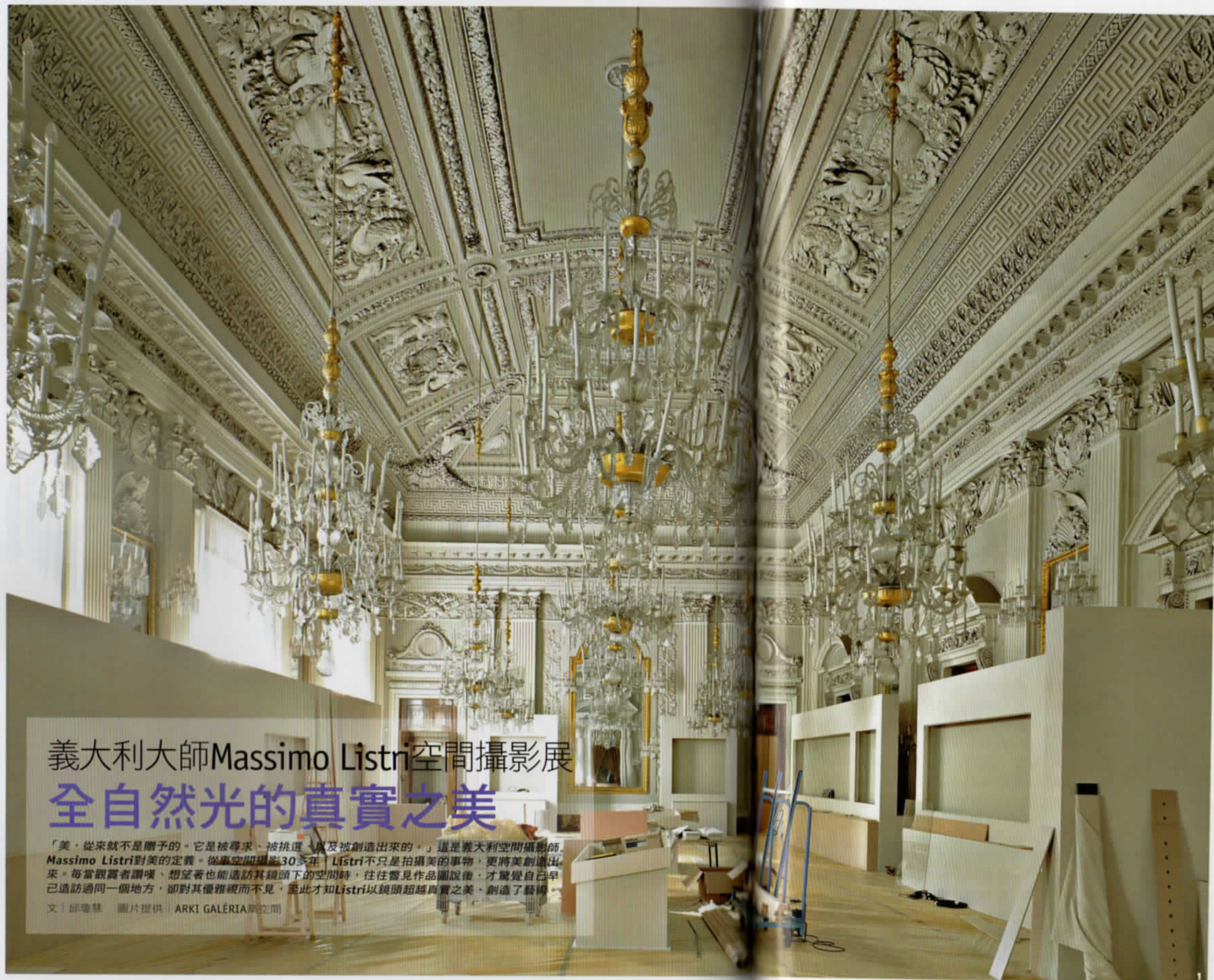
1. (White Room in Palazzo Pitti—Florence) 碧提宮是佛羅倫斯大型建築古蹟之一，也是佛羅倫斯最重要博物館之一。