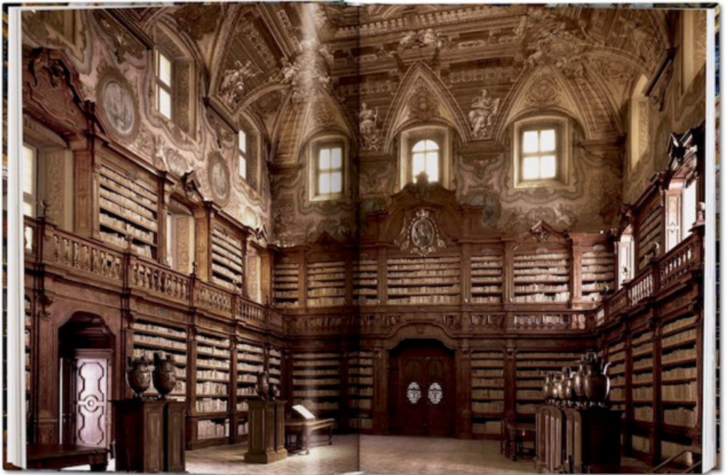
Biblioteca de Girolamini, en Nápoles.

La sensación de entrar en una gran biblioteca es difícilmente comparable. Tesoros arquitectónicos de todas las épocas que se mezclan con la apabullante conmoción de las millones de historias que encierran. ¡Bibliófilos, disfrutad!