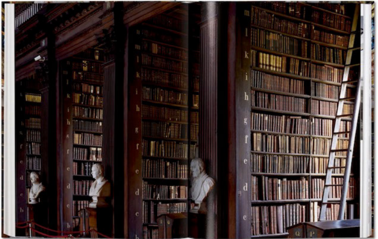
Biblioteca del Trinity College, Dublín, Irlanda.

La Trinity College es la universidad más antigua de Irlanda. Ubicada en el centro de Dublín , su biblioteca alberga la mayor colección de manuscritos y libros impresos del país. Actualmente posee casi tres millones de libros repartidos en ocho edificios. El más antiguo de estos, y también el más espectacular, fue construido entre 1712 y 1732 y en él se encuentra la sala que Massimo Listri retrata para este libro, la Long Room .