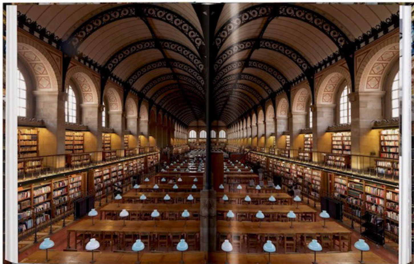
Bibliothéque Sainte Genevieve, París.